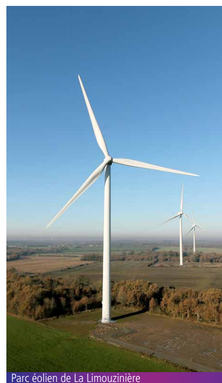
Parc éolien de La Limouzinière

Alors ensemble, mobilisons-nous et épargnons le climat !