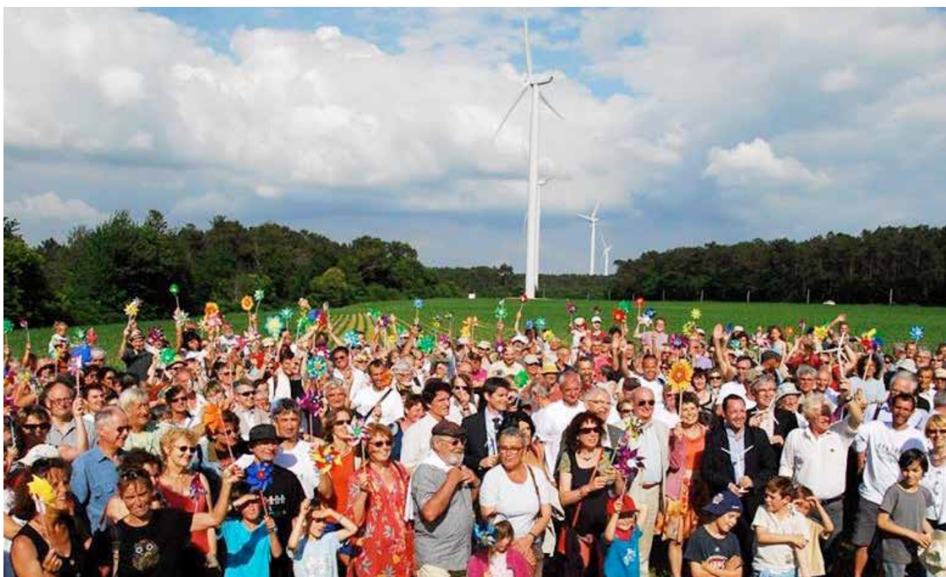
Inauguration du parc éolien de Béganne

Le Compte à Terme Nef "Épargnons le Climat" , quant à lui, est un compte d'épargne développé dans le cadre de cette campagne. Il offre la possibilité d'orienter son argent vers le financement de projets bénéfiques pour l'environnement et de reverser tout ou partie de ses intérêts à l'association négaWatt. 2